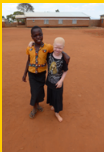
Dikke maatjes in Malawi