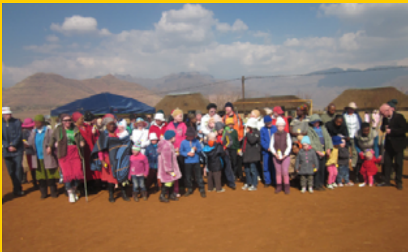
Het uitdelen van zonnebrandcrème in Lesotho

De opkomst was zeer groot: er waren personen van ver gekomen om deze meeting mee te maken. Onze contactpersoon uit Lesotho gaf aan dat de ontmoeting heel waardevol was voor de aanwezigen. We hopen in 2015 snel weer een transport te kunnen leveren aan Lesotho!