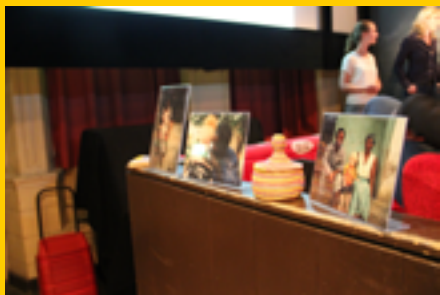
Presentaties in de filmzaal

In de sfeervolle filmzaal van theater 't Hoogt hebben we de documentaire Albino United gekeken. Het was al met al een zeer gezellige, leerzame en feestelijke dag! We blijven ons inzetten voor de albino's in Afrika, en we hopen bij een volgend lustrum nog steeds structureel hulp te bieden aan nog meer mensen met albinisme in verschillende Afrikaanse landen.