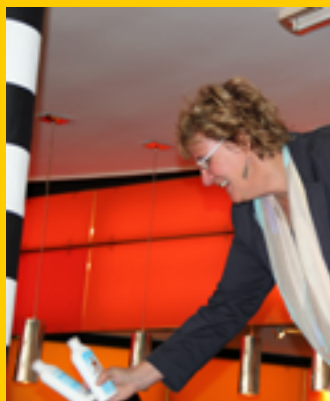
Mooie prijzen bij de quiz